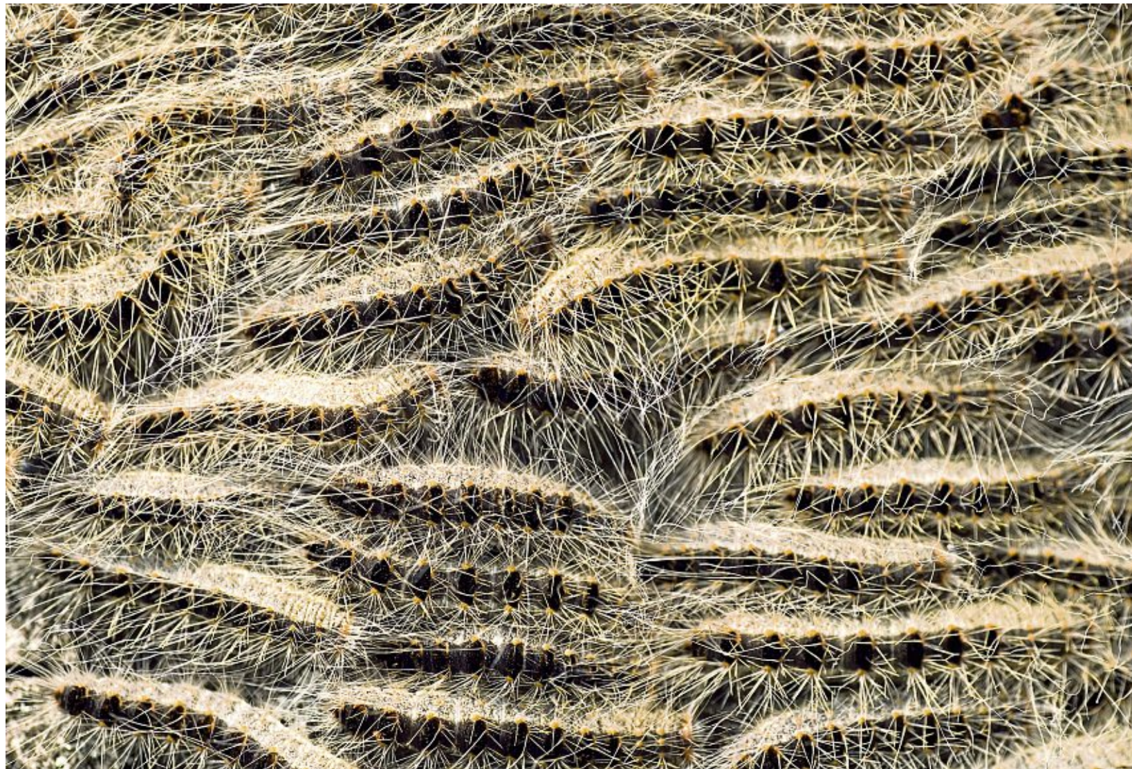
Ein Nest des Eichenprozessionsspinners

Massenentwicklungen des unscheinbaren Nachtfalters und seines Nachwuchses hat es allerdings auch schon früher gegeben – wenn auch nicht in diesem Ausmaß. „In unseren Eichwäldern hält sich eine Art von graufarbenen haarigen Raupen auf, die ... in ganzen großen Zügen dicht aneinander und aufeinander von einem Baum zum anderen